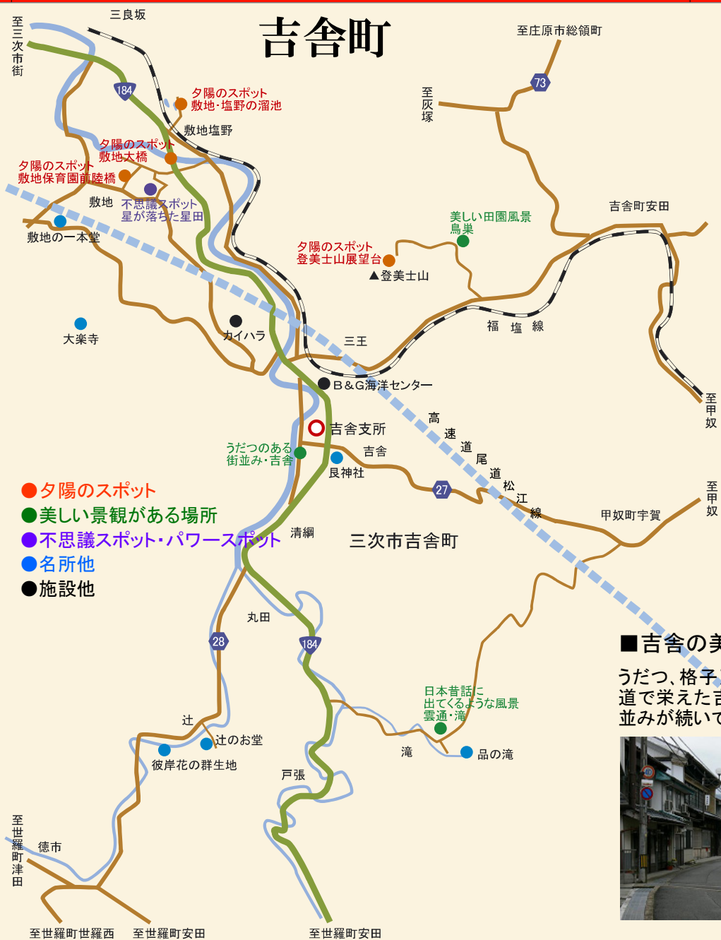
■ 敷地保育園前陸橋より